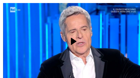
Claudio Baglioni, show a Domenica In con Mara