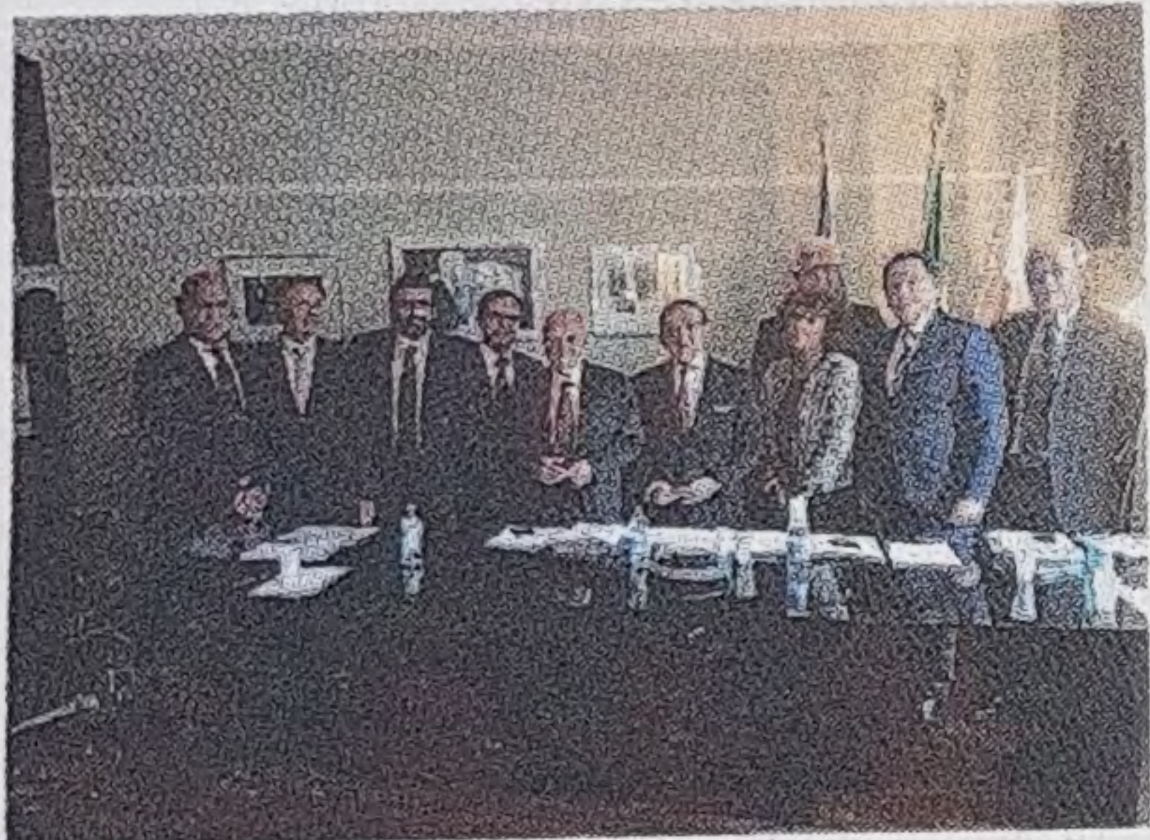
Il Consiglio Nazionale dell'INRL con il presidente del Cnel, Tiziano Treu (al centro della foto).

principi di trasparenza, competenza e professionalità, che è stata sottoscritta da quei revisori legali iscritti all'Inrl e candidati alle prossime elezioni politiche, per dare un tangibile contributo al risanamento socio-economico del paese.